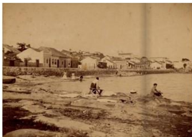
Figura 2 – Praia do Riacho, 1900

O fato de já se encontrar estabelecido em Porto Alegre em 1885 – ou 1881, conforme o habeas-corpus – na rua do Riacho (atual Washington Luís) nos leva a rever o percurso geralmente atribuído, de chegada em Rio Grande e trânsito por Bagé e Pelotas, até se estabelecer na capital em 1901, sob chamado de Júlio de Castilhos, para que o curasse. Das duas uma: ou a sequência não está correta e ele esteve anteriormente na capital, ou ali se estabeleceu diretamente. A narrativa geralmente aceita, portanto, se fragiliza. Isso pode nos levar a rever a relação entre o príncipe Custódio e o patriarca da República no Rio Grande do Sul. Já em 1892 estava envolvido na aquisição de ações do Prado na capital.