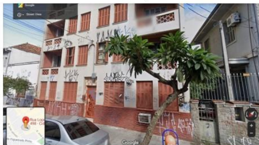
Figura 3 – Edifício localizado no antigo endereço do Príncipe Custódio, Lopo Gonçalves, 498, Cidade Baixa

encorajou o fazendeiro rio-pardense a dirigir-se ao seu encontro em busca de cura para seu filho na capital. É verdade que a casa do príncipe e o Hospital Psiquiátrico São Pedro ficavam em Porto Alegre, e que ele poderia simplesmente ter aproveitado a desculpa de uma visita ao manicômio para encontrar Custódio – e cumprir suas obrigações religiosas? –, porém não podemos deixar de notar que a reputação do príncipe no campo dos mistérios da religiosidade extrapolava os limites da municipalidade.