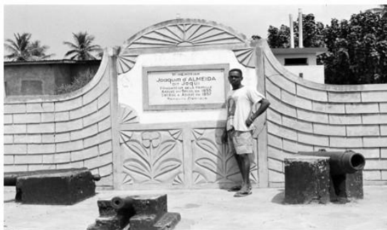
Figura 1 – Monumento à memória de Joaquim d’Almeida, dito Zoki Azata, com um dos seus descendentes. Zoki voltou do Brasil para Agué em 1835, vindo a falecer em 1857 – Cemitério de Agué, Benin.